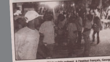
Les enfants ont émerveillé le public présent à l'Institut français, Georges Méliès, Ouagadougou.

Un séjour marqué par des prestations diverses dans le quartier de Goughin de Ouagadougou, un quartier de la ville de Grenoble à visiter au Burkina dans le cadre d'un programme d'échange culturel de 23 février au 10 mars dernier. Ils ont rencontré par des professeurs et des artistes des jeunes burkinabés. Un échange culturel qui devrait à terme permettre la création d'un groupe de Batucada à Ouagadougou.