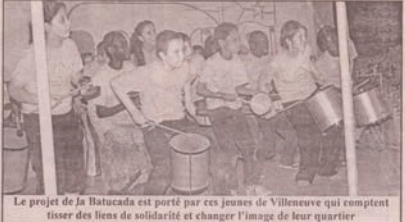
Le projet de la Batucada est porté par ces jeunes de Villeneuve qui comptent tisser des liens de solidarité et changer l'image de leur quartier

Au départ, une idée simple : travailler à revaloriser l'image de leur quartier Villeneuve, la BatukaVI et compagnie est devenue facteur de cohésion sociale entre les peuples. C'est cette idée que les jeunes français de Grenoble sont venus partager avec la jeunesse burkinabé du 25 février au 10 mars 2013.