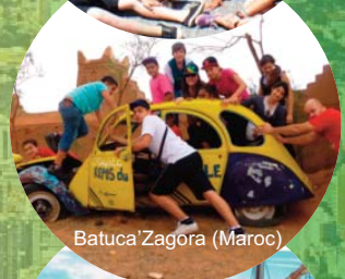
Batuca' Zagora (Maroc)