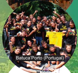
Batuca' Porto (Portugal)