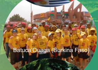
Batuca' Ouaga (Burkina Faso)